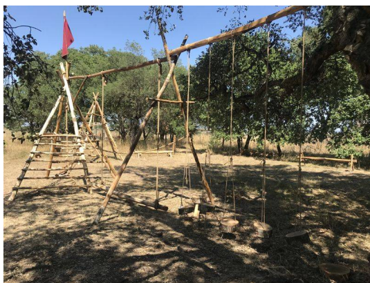
ROMA WORLD: Percorso avventura

Il parco è aperto tutti i weekend e festivi dalle 11 alle 18 e tutti i giorni in estate, nel rispetto dei protocolli e delle